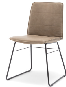
STU-KU mit Husse Stuhl mit Kufe und Husse