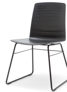
STU-KU Stuhl mit Kufe