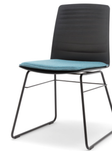
STU-KU mit SIK Stuhl mit Kufe und Sitzkissen