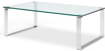
Glas-Couchtisch 70 x 120 cm Stahl-Kufe, Glanzchrom Höhe: 40 cm