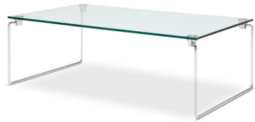
Glas-Couchtisch 70 x 120 cm Stahl-Rundrohrkufe, Glanzchrom Höhe: 40 cm