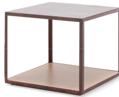
Couchtisch: 50 x 50 cm Höhe: 50 cm Tischplattenfarbe: Betonlook und Eiche natur. Gestellfarbe: Edelrost