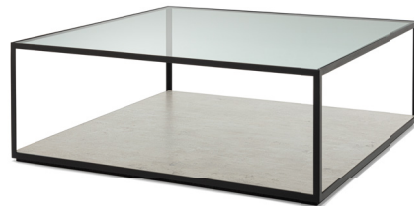
Couchtisch: 110 x 110 cm Höhe: 40 cm Tischplattenfarbe: Klarglas und Betonlook Gestellfarbe: RAL 9005 Tiefschwarz